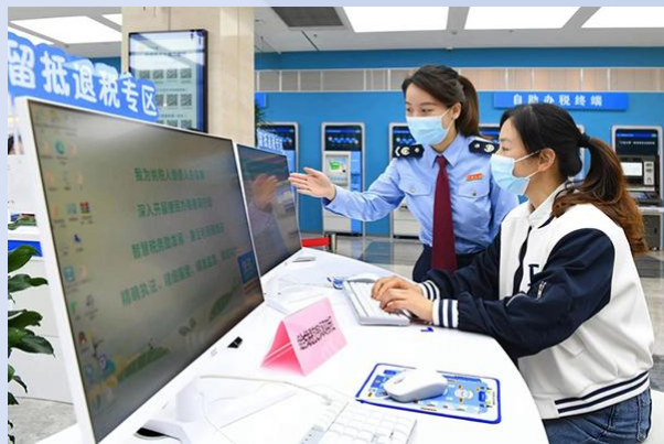
国家税务总局宁海县税务局以“专岗+专员”模式辅导纳税人办理增值税留抵退税。

为了展现建议、提案从“纸上”落到“地上”的工作进展，人民网财经连续三年采访了相关人大代表、政协委员与部委单位，挖掘政策举措出台背后的故事，推出了“民有所呼 政有所应”部委建议提案办理工作系列报道。